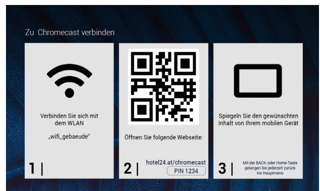
Detailseite mit der Verbindungsanleitung