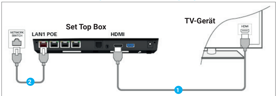
Abbildung 2: Kabelverbindungen - PoE